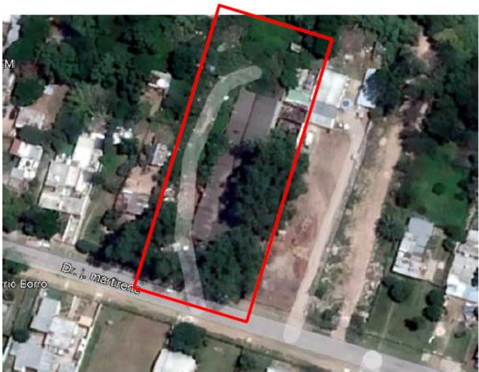
FOTO AEREA 2024.